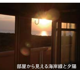
部屋から見える海岸線と夕陽

額! 市が管理するので安心。しかも鉄筋コンクリートなので、とても丈夫。千里浜海岸までは歩いて5分という魅力! 2013年(平成25年)から能登有料道路が無料化になるので、お仕事が金沢や七尾の方も安心です。3DKでバルコニーも付いており、なんと海が見える部屋も! お問い合わせは羽咋市役所建設課施設管理係まで今すぐお電話!