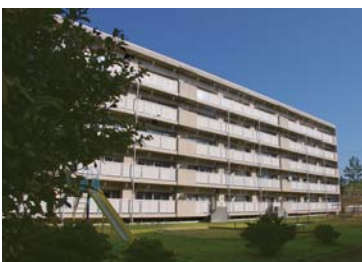
島出住宅の外観。公園もあります。