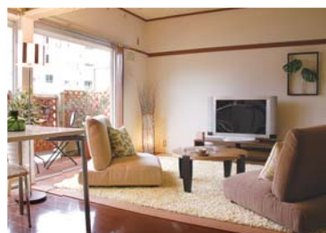
リビングで安らぎのひと時